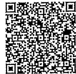
スマートフォン専用QRコード

お持ちのスマートフォンを使って、定期的に確認することを推奨します。 ※QRコードを読み取るアプリをご利用ください。